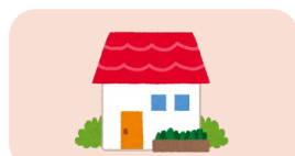
レスパイト・リハビリ