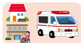
軽微な急変時の治療