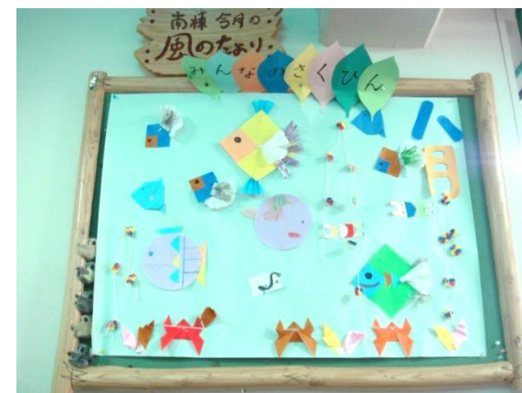
[写真：南棟 レクリエーション作品展示]