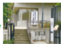
↑スロープもあります