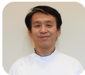
田無病院 看護部長